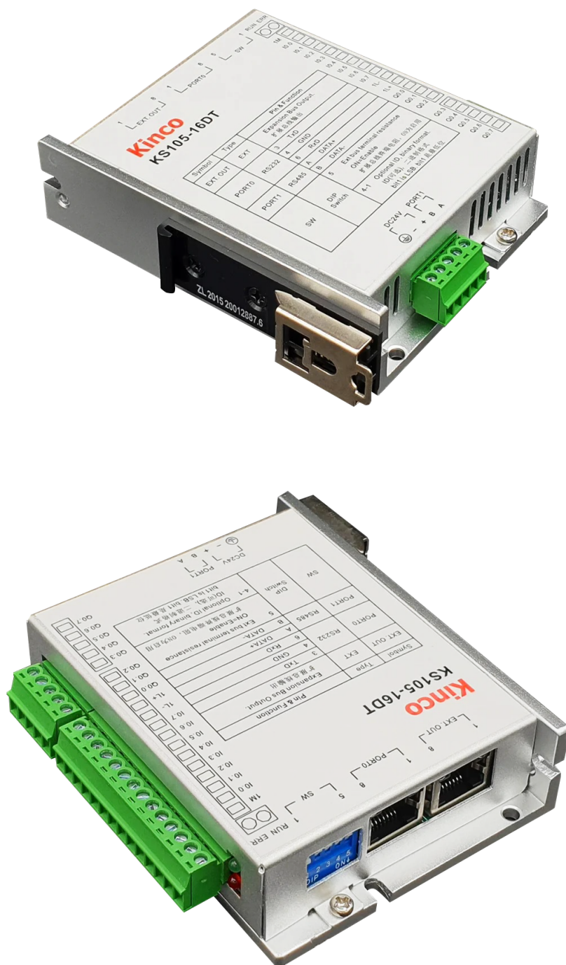
Рисунок 1 — Внешний вид PLC контроллера KS105-16DT.