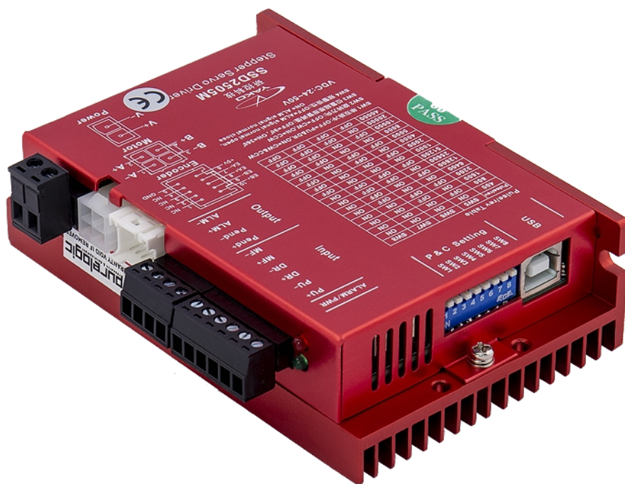
Рис.1. Внешний вид драйвера