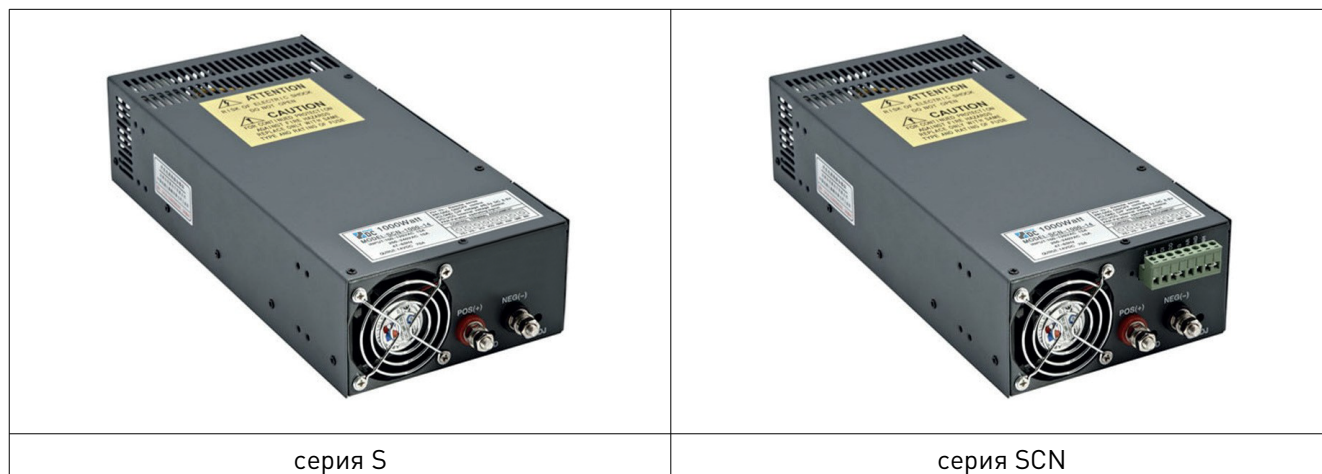
Рис. 1. Внешний вид источников питания