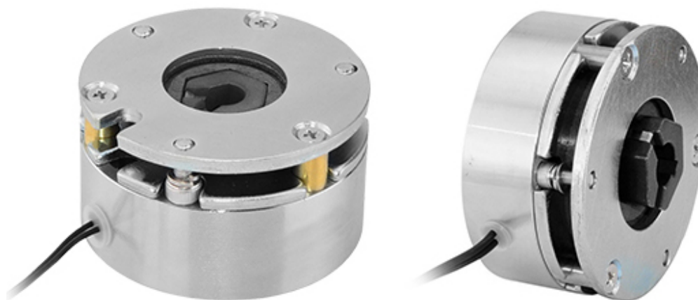
Рис. 1. Внешний вид электрического тормоза